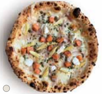
○ サルモーネ 1,280 Salmone スモークサーモン、赤玉ねぎ、ベビーコーン、ケッパー、サワークリーム Smoked Salmon, Red Onion, Baby Corn, Caper, Sour Cream