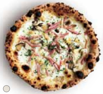
○ ミケランジェロ 1,250 Michelangelo 4種のきのこ、ベーコン、タレッジョ Mushrooms, Bacon, Taleggio