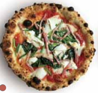
● スピナッチ エ リコッタ 1,210 Spinaci e Ricotta ほうれん草、ベーコン、リコッタチーズ Spinach, Bacon, Ricotta