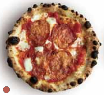
● ディアボラ (辛) 1,150 Diavola サラミピカンテ Italian Spicy Salami