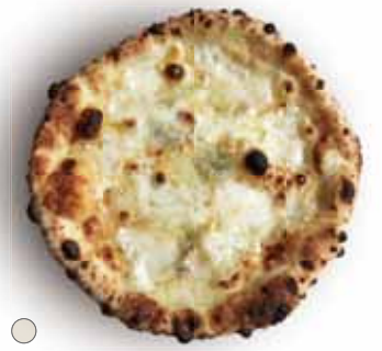
○ クアトロフォルマッジ 1,280 4 Formaggi タレッジョ、ゴルゴンゾーラ、モッツアレラ、グラナパダーノ Taleggio, Gorgonzola, Mozzarella, Grana Padano