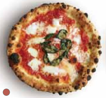
● マルゲリータ 1,100 Margherita フレッシュバジル、モッツアレラ Fresh Basil, Mozzarella