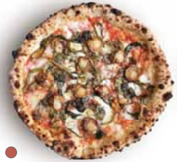
● カベサンテ 1,200 Capesante ベビーホタテ、フリリエッリ、ケッパー、オレガノ Small Scallop, Rapini, Caper, Oregano