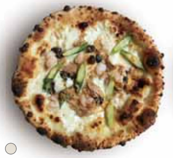
○ トンノ 1,150 Tonno ツナ、海老、アスパラ、オリーブ Tuna, Shrimp, Asparagus, Olive