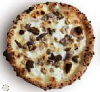
○ ノルチーナ 1,280 Norcina サルシッチャ、クルミ、ボルチーニ、トリュフオイル Salsiccia, Walnut, Porcini, Truffle Oil