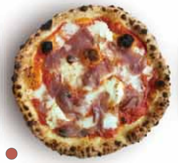
● モンテローザ 1,250 Monte Rosa 生ハム、マスカルポーネチーズ、トマトクリームソース Prosciutto, Mascarpone, Tomato Cream