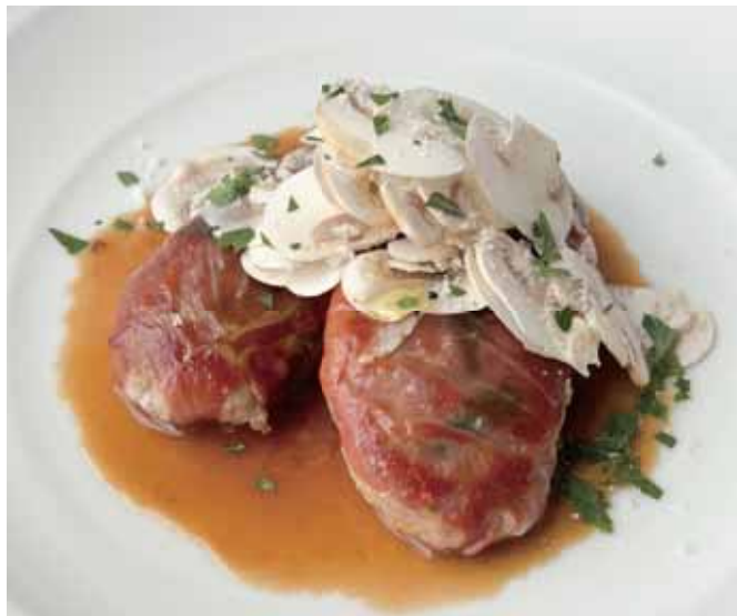
蔵王産 JAPAN Xのサルティンボッカ 八幡平マッシュルーム Zao Pork Saltimbocca