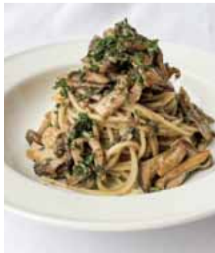
4種類のキノコのスパゲッティ Four Kinds of Mushrooms Spaghetti