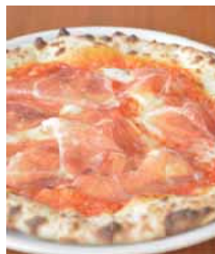
モンテローザ パルマ産生ハム、マスカルポーネチーズ、 トマトクリーム Monterosa Prosciutto, Mascarpone, Tomato Cream