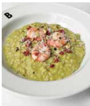
海老とピスタチオ ドライマトのリゾット Shrimp Pistachio Risotto with Sun-dried Tomatoes