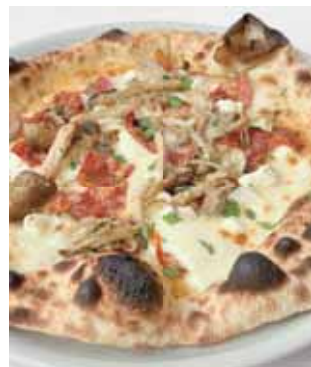
フンギ ビアンコ きのこ、サラミピカンテ、モッツアレラ Funghi Bianchi Mixed Mushrooms, Spicy Salami, Mozzarella