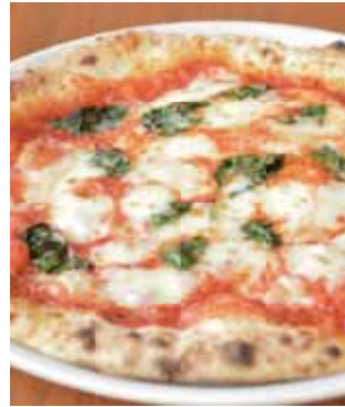
マルゲリータ フレッシュバジル、モッツアレラ、 トマトソース Margherita Fresh Basil, Mozzarella, Tomato Sauce