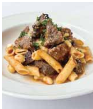
8時間煮込んだ牛タンの ラグーソースと白インゲン豆の ペンネ 8-hour Slow Braised Beef Tongue Ragu Penne with Cannellini Beans