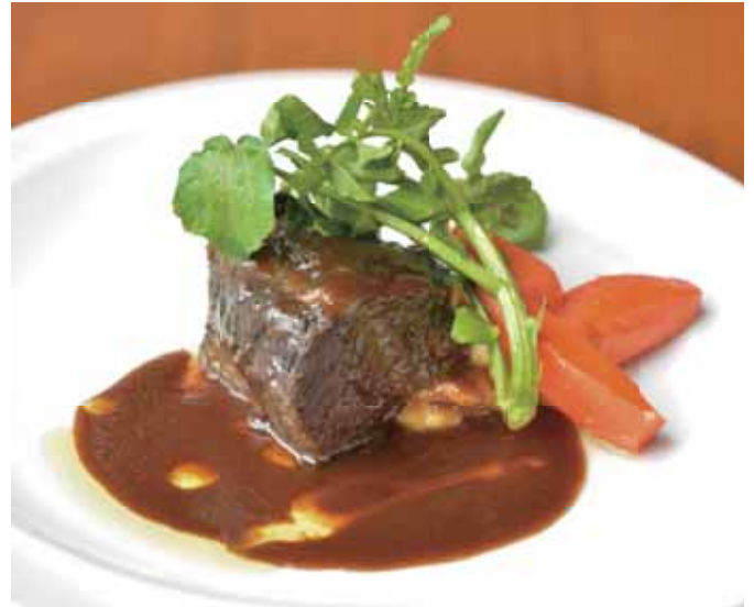
牛頬肉のバローロワイン煮込み Braised Beef Cheek in Barolo Wine