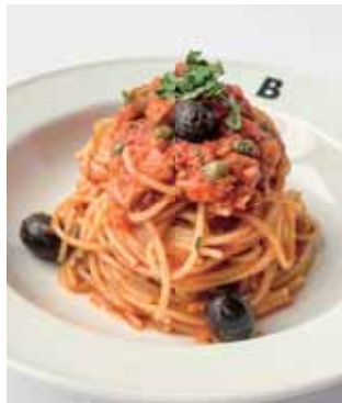
ツナとオリーブのプッタネスカ Tuna and Olive Puttanesca