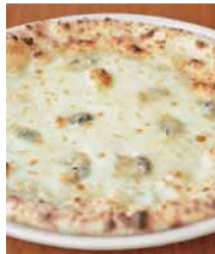
クアトロフォルマッジ タレggio、ゴルゴンゾーラ、モッツアレラ、 グラナパダーノ Quattro Formaggi Taleggio, Gorgonzola, Mozzarella, Grana Padano