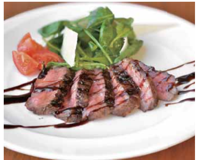
日高見牛サーロインのタリアータ Beef Sirloin Tagliata